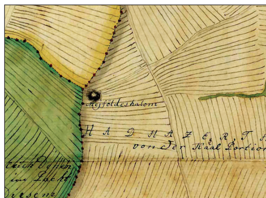
A Mélyföldes-halom ábrázolása egy 1808-ból származó térképen