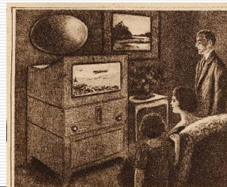
A jövő rádiókészüléke. Ujabban mind inkább tökéletesedik a távolbalató készülék és így kétségtelen, hogy nemisokár a rádióelőfizető nemcsak hallani, hanem látni is fogja a távolból leadott műsort, híreket, képeket